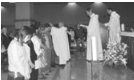
Grupo de Askartza.