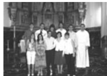
Grupo de Donostia.