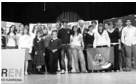
Escolares y autoridades.

L os alumnos de 4 o de la ESO y 2 o de Bachiller del colegio Larraona (Pamplona) han participado un año más en la Campaña Mundial de la Educación, celebrada este año en el salón de actos del colegio de los jesuitas, bajo el lema "Todos los niños y niñas necesitan Profes/ Ume guztiek irakasker behar dituzte".