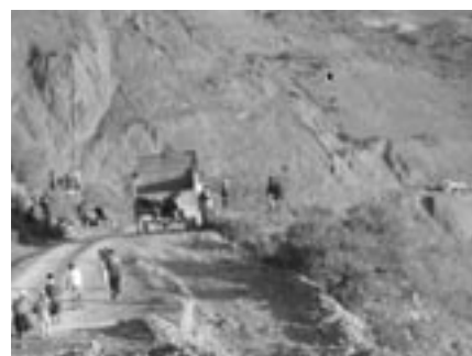
Derrumbe en el camino que impide el que la gente pueda seguir su viaje en movilidad.

E ste año 2006 pasará a la historia del altiplano boliviano como uno de los más lluviosos. Durante los meses del verano boliviano ha llovido mucho en todo el país. En el Norte de Potosí las consecuencias han sido manifiestas: caminos difíciles e imposibles accesos a algunos pueblos y comunidades... Las poblaciones más perjudicadas han sido San Pedro de Buena Vista y Toro Toro. La erosión galopante, la inconsistencia de muchos terrenos y la pertinaz lluvia han hecho que moverse por el territorio misionero haya sido tarea imposible.