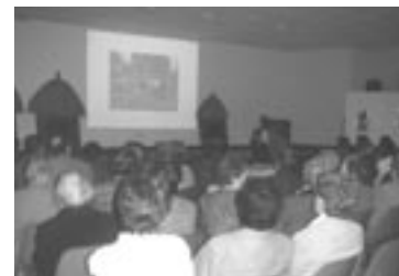
Salus presentando la realidad de Guinea Ecuatorial y el proyecto de Niefang.

Aurtengo egitasmoaren bidez, Ekuatore Gineako Niefangeko eskolarako bina laguntzako 125 ikasmahai erosten lagundu nahi dugu. Kanpaina amaitzeko, Ekuatore Gineako Salus klaretarra izan dugu gure artean, hango ohiturak, bizimoduak, kultura eta abarren berri emanez. Ekuatore Gineako Niefangeko eskolan lantzen ari diren egitasmoaz hitz egin ziren. Hitzaldiaren ondoren, parrokiako 86 lagun gazte nahiz heldu elkartu ginen, ohiturari jarraiki, Indiako milioika lagunek egunero jaten dutenaren antzeko afari batez "gozatzeko".