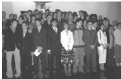
Grupo de Iruña.

A pirilean eta maiatzean Larraona, Askartza-Claret eta Mariaren Bihotzako gazte batzuek sendotza jaso zuten Jesus jarraitzeko asmoa azalduz. Hainbat urtetan bilerak, elkarbizitzak, kanpamenduak, bazkoak eta beste hainbat ekintza burutu eta gero beraien fedea aitortzeko erabakia hartu dute gazte hauek. Ospakizunak hunkigarriak suertatu dira. Gotzainek bereziki animatu zituzten gazte hauek Jesus jarraitzeko bizitzan asmatzeko. Giro berezi horretan Espiritu Santuaren indarra jaso zuten.