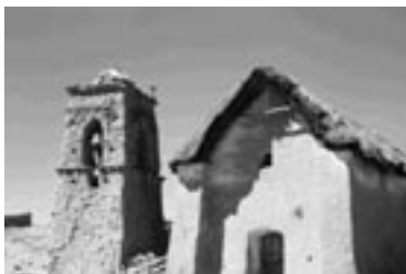
Imagen de una capilla rural.

Pocas instituciones apoyan la construcción o refacción de iglesias o capillas rurales. Tal vez sea el prurito aconfesional o laical existente en casi todos los países financiadores el que está impidiendo el apoyo a este tipo de iniciativas. Pero la capilla normalmente en las comunidades rurales es mucho más que un lugar de culto. Es un lugar de reunión, un lugar de capacitación, un lugar de encuentro y, claro está, un lugar de celebración religiosa. Cumple, por lo tanto, una función más rica y compleja que la clásica de ser un ambiente exclusivo pa-