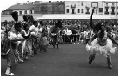
El Grupo Elkartu ofrece una danza de Guinea.