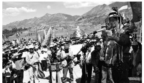
Discurso de Evo Morales en T'oro-T'oro.