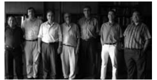
Visita a la comunidad de Larraona.