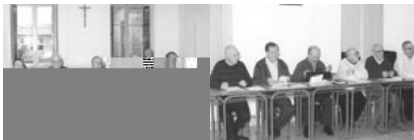
Grupo de participantes.

A lo largo del Curso 2005-2006 se está realizando un Taller de Jubilación dirigido a los Misioneros Claretianos de la Provincia que han entrado en esta etapa de la vida. Por medio de tres encuentros se pretende iluminar y acompañar a estas personas para hacer de la jubilación una etapa fecunda e iluminadora de la propia vida. Las charlas, la lectura, el compartir experiencias y reflexiones y la celebración de la fe son los ejes en torno a los cuales giran estos encuentros.