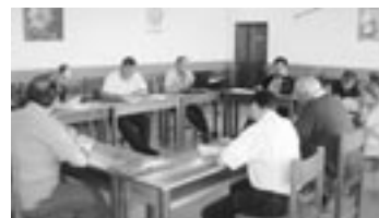
A la izquierda, acogida en San Pedro de Buenavista; fotografía superior, reunión con el Padre Provincial.